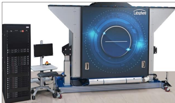
Spectral Radiance at Full Power